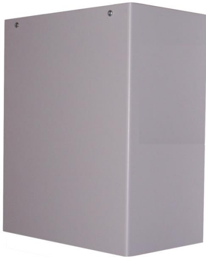
Ethernet Pausen-Signalisierung UniSignal NT